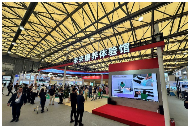
CHINA AID 出展時の様子（2024年6月）