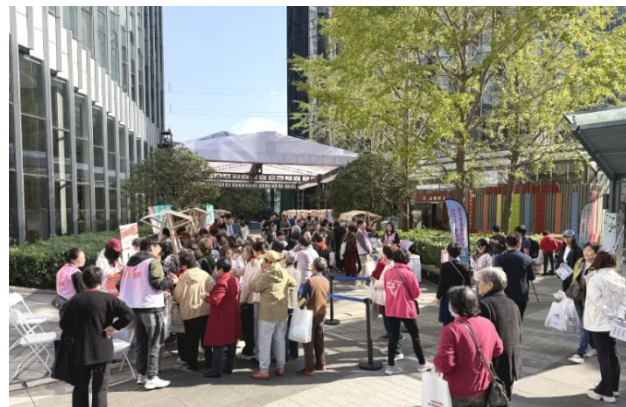
上海市で開催された介護用品体験会の様子（2024年6月）

※1 中国でも少子高齢化が加速しており、2035 年前後には 60 歳以上の高齢者人口が 4 億人を超えると予測されており、特に在宅介護の急拡大が予想されている。また、中国政府は 2021 年 3 月に高齢化社会への対応を「国家戦略」に格上げするなど高齢者への対応を強化。